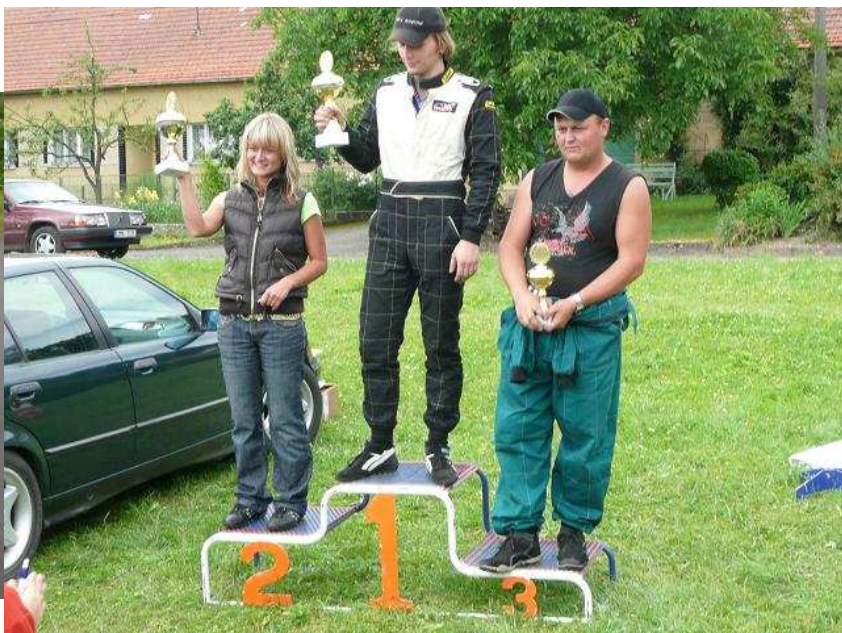
Závodnice na trati a na stupních vítězů